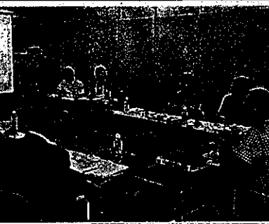
先進事例を基に、議論する市民ホール建設検討委員会メンバー

3回目の会合は7月31日に同市役所で開催。北大大学院工学研究院が、茅野市民館(長野県茅野市)とアオーレ長岡(新潟県長岡市)の二つの複合施設の事例報告をした。 茅野市民館は図書館、美術館、劇場の複合施設。図書館機能がなくなり、目的がなくても立ち寄れる空間が特長で、同研究所の研究員は「構想や計画の策定段階から時間をかけ、市民と行政の信頼関係が