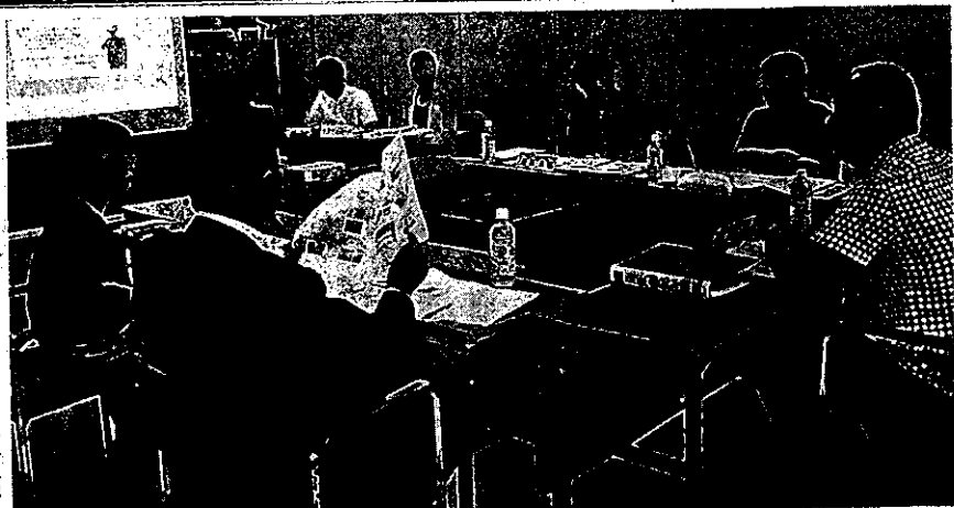
新たな市民ホールの参考とするため、道外の複合公共施設の説明を受ける委員ら