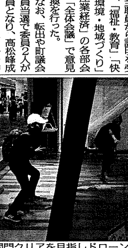
五つの関門クリアを目指しドローンを飛ばす挑戦者

「品川ヒロシ監督映画」の概要発表記者会見が行つた。 「森喜劇」は町民と連携して制作する。映画は後日掲載。